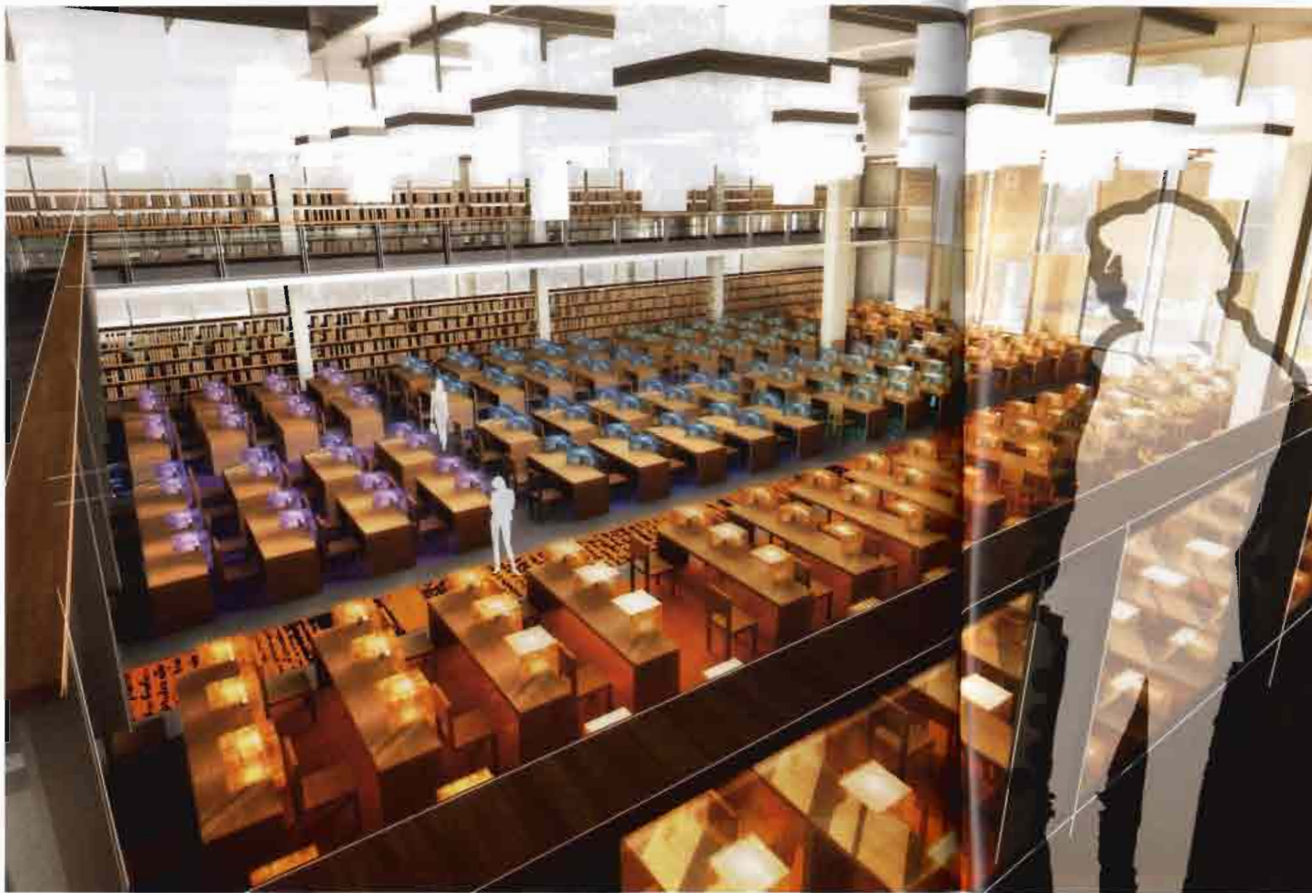
Konzorcijum biblioteka Srbije za objedinjenu nabavku (KOBSON) omogućava pristup elektronskim bazama stranih časopisa sa oko 35.000 naslova u punom tekstu i oko 80.000 knjiga. U Konzorcijumu je 130 biblioteka