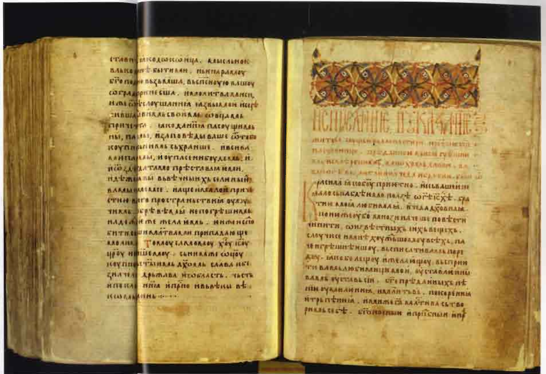
Rukopisne knjige i inkunabule, prve srpske knjige, štampane od 1494. godine kada je objavljen cetinjski Oktoih do 1683. godine, jesu nacionalna kulturna dobra. Čuva ih Arheografsko odeljenje i brine o njihovoj zaštiti